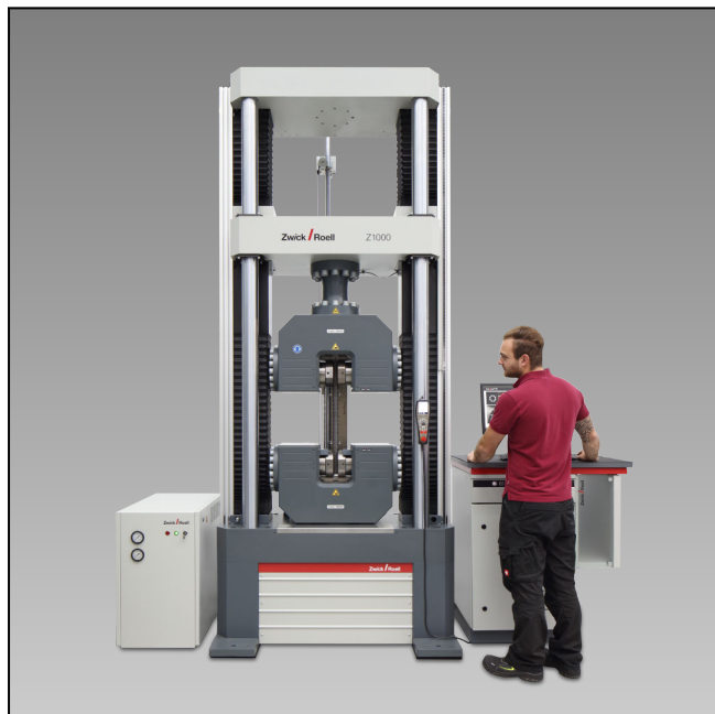
Z1000E mit Hydraulik-Probenhalter