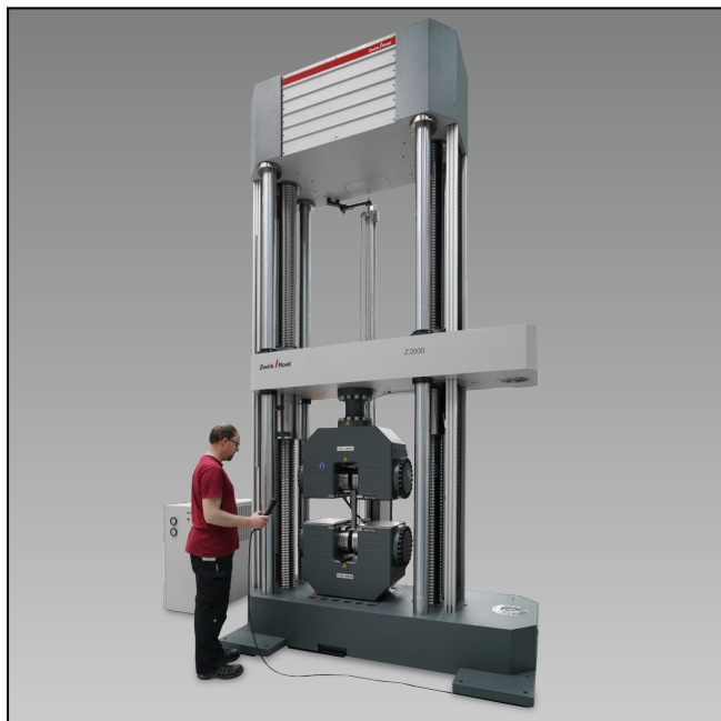
Z2000ES mit Hydraulik Probenhalter