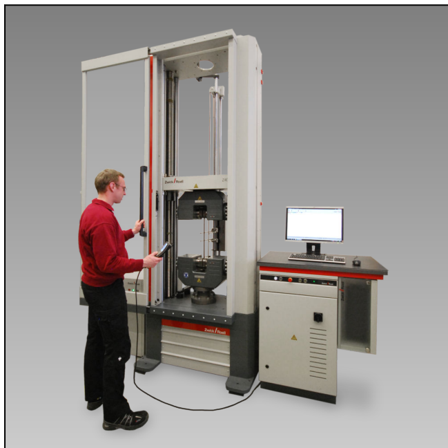
Z400E mit Hydraulik-Probenhalter