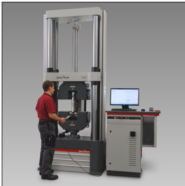
Z600E mit Hydraulik-Probenhalter