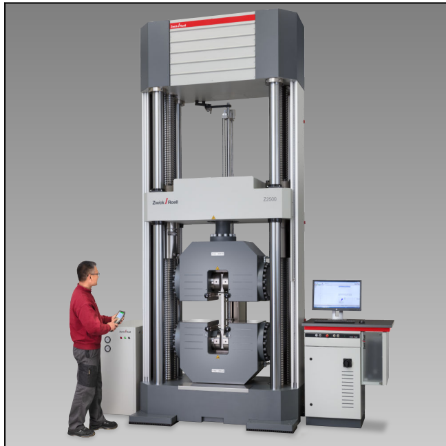
Z2500E mit Hydraulik-Probenhalter