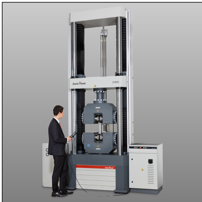
Z1600E mit Hydraulik-Probenhalter